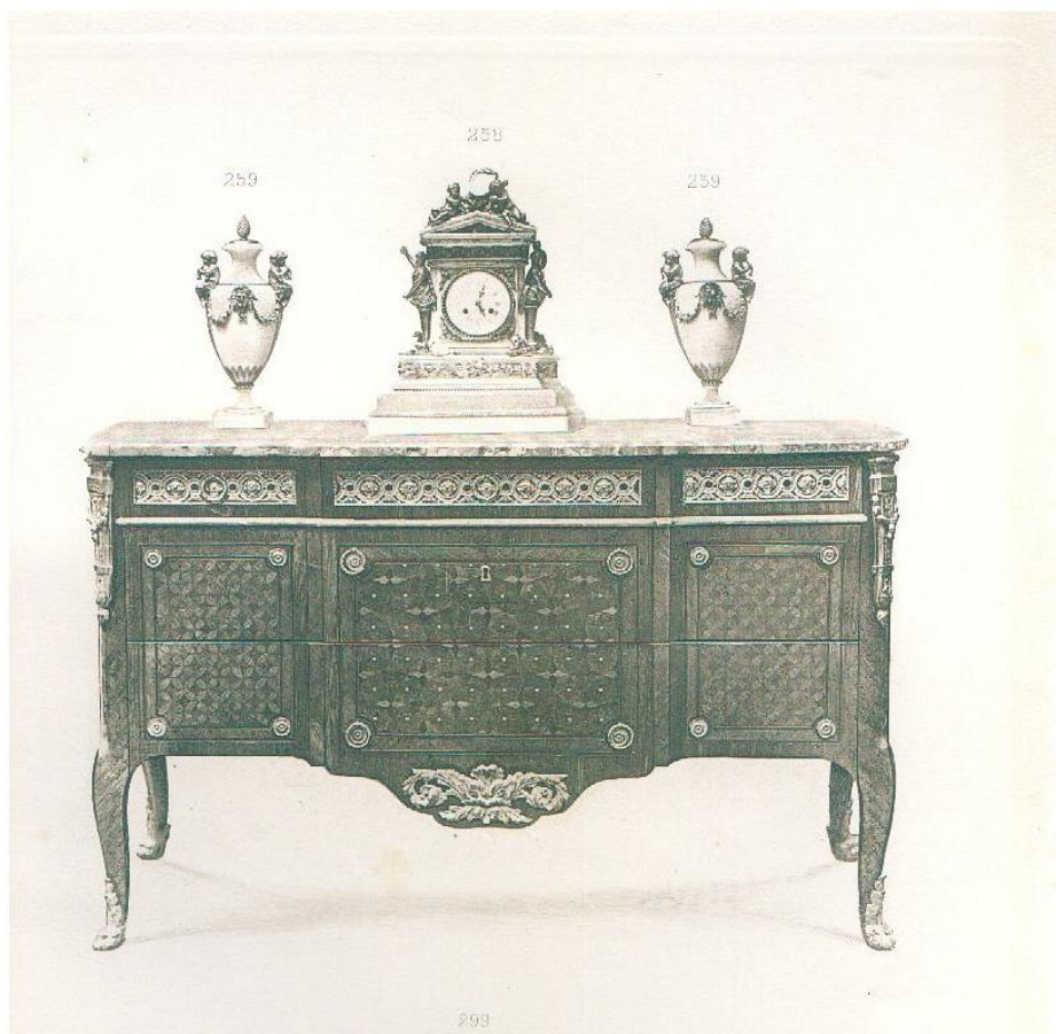
Collection M. RIKOFF

Vente Galerie Georges PETIT, Paris. 4 au 7 Décembre 1907, n°299. (18100F Or).